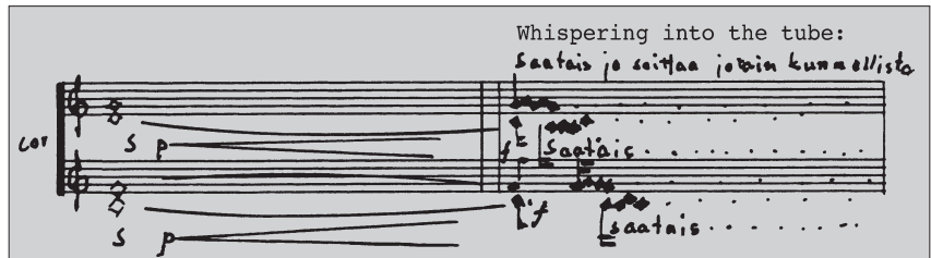
Esimerkki 3: käyrätörvien paljastavia kuiskauksia soittimien sisään konsertin loppupuolella.

veltäjän otsaa liikaa, mistä todistavat myös huilukonsertin orkesterin puhaltajien stemmoihin kirjoitetut, soittimiin kuiskattavat repliikit. Vaikka teosta seuraava ei voi kuulla lausahduksia “Taas se soitti kummallisesti” tai “Saatais jo soittaa jotain kunnollista, tässä vaan ollut tätä tämmöstä...”, sisältyy niihin selkeää itseironiaa. Vielä aivan konsertin loppumetreillä orkesterin huilistit muistuttavat kuiskien kantaesityksen ajasta, paikasta ja esiintyjistä.