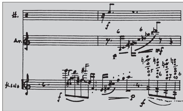
Esimerkki 2: tom-tomin ja harpun kommentteja soolohuilun teksturiin, joka tässä kohtaa huipentuu multifonitremoloihin. Levottomana liikehtivä soolohuilu johdattelee eleillään musiikkia kohti konsertin huipennusta.