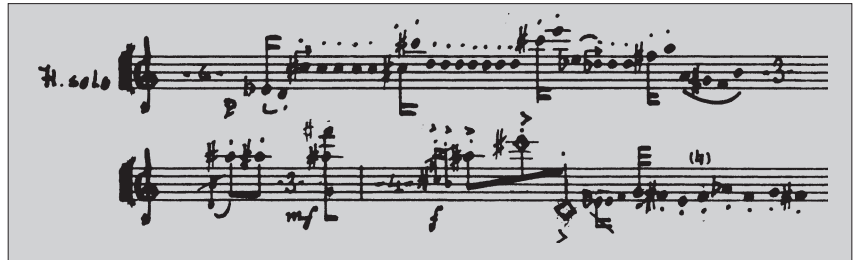
Esimerkki 1: soolohuilun avausrepliikki partituurin sivulla 2. Vapaapulsatiivisia, nopeita repetitioita, multifoni, jet whistle, suhinaääni. Partituuri on painettu Meriläisen käsikirjoituksesta.

Meriläinen ei halunnut pysytellä tiukan sarjallisuuden otteessa ja suosi sävelkielessään joustavampaa systeemiä korostaen erityisesti sointivärejä. Modernismin pipo ei siis kiristänyt sä-